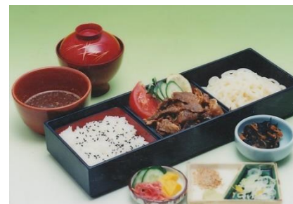
スタミナセット 1,350円