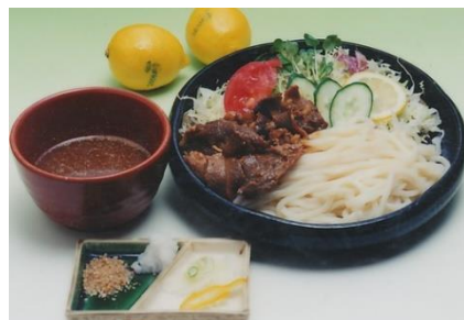
スタミナうどん 950円