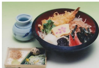
冷やし天ぷらそば 1,200円