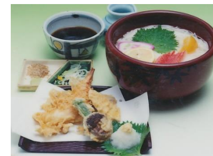
天ぷら付き冷麦 1,350円